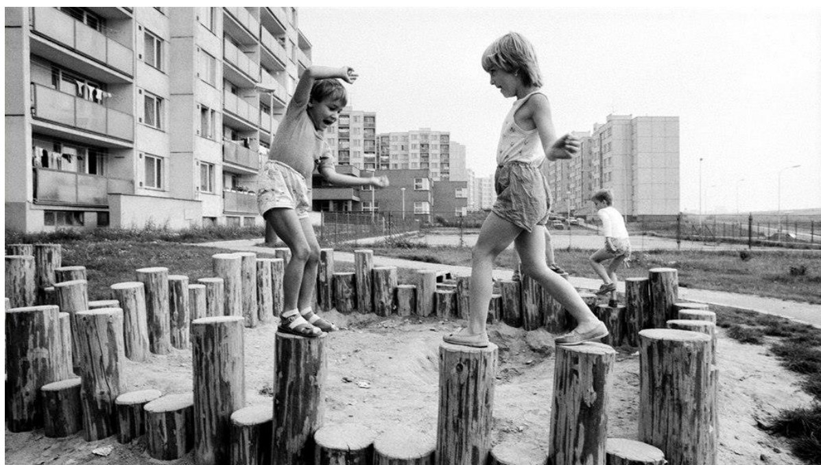
Dětské hřiště na pražském panelovém sídlišti Černý Most (září 1984)

Bydlení v dobách socialismu bylo pro řadu lidí problém. Byty scházely a nebyly pro každého. Dekrety se mnohdy měnily za úplatu a výměnné akce typu „kulový blesk“ nebyly filmovou komedií. Kdo však získal státní byt, měl jisté, že nájem bude za pár korun. A to doslova.