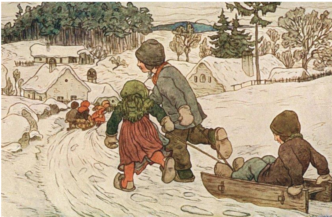
Sáňkování. Autor Richard Luda. — Zdroj: archiv Bejvávalo.cz

Jak vzniká sníh? V článku z roku 1925 pro vás máme dávnou legendu o jeho vzniku, kterou jistě neznáte. K tomu navíc velké množství lidových pranostik, které předpovídají sníh na Vánoce. Myslíte, že budou platit i letošní zimu?